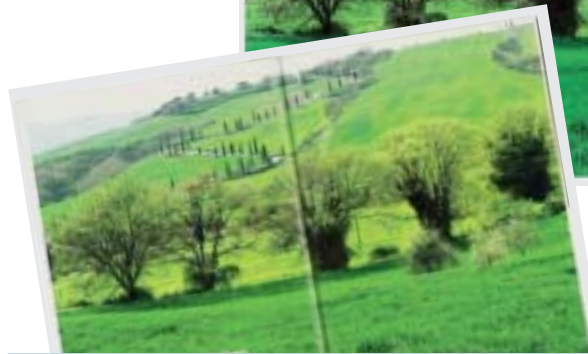
FARBFEHLER Grün ist nicht gleich Grün – Farbfehler können die Freude am Fotobuch mindern.