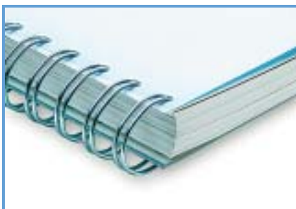
BINDUNGEN UND MATERIALIEN Hardcover (oben), Softcover mit Drahtheftung (Mitte) und mit Drahtkammbindung (unten).

die Anbieter eine mehr oder minder große Auswahl an Kombinationsmöglichkeiten. Die meisten unterschiedlichen Formate haben albumfactory, Lidl, myphotobook.de und pixopolis, die wenigsten Aldi und PixelNet. Zwischen matten und glänzenden Seiten kann man bei keinem Anbieter wählen.